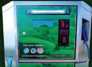
DYSTRYBUTOR PŁYNU DO SPRYSKIWACZY