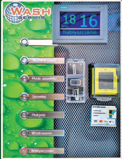
Panel sterujący z czytelnym wyświetlaczem wyposażony w czytnik kart płatniczych i lojalnościowych