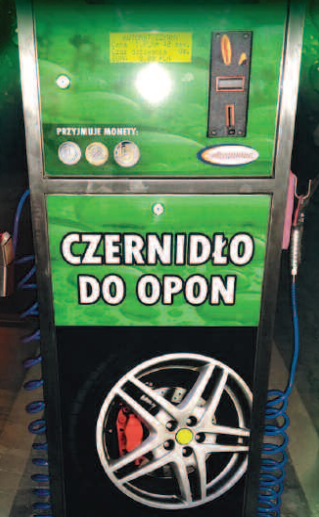
CZERNIDŁO DO OPON