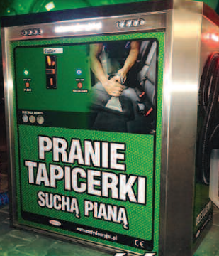
PRANIE TAPICERKI SUCHĄ PIANĄ